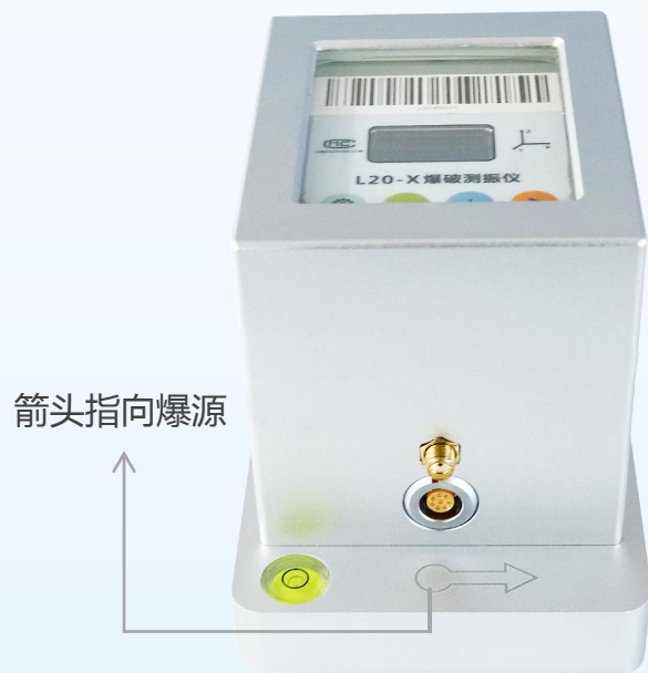
第一步：安装仪器 仪器水平放置于保护物迎爆侧基岩处