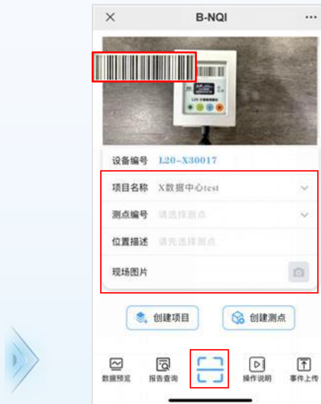
第二步：手机扫描条形码 创建或选择项目，完善项目、测点信息