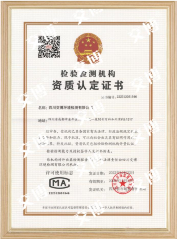
检验检测机构资质认定证书

交博检测持有 乙级测绘资质证书 、 检验检测机构资质认定证书 等资质，涵盖爆破有害效应监测及工程测量所需资质