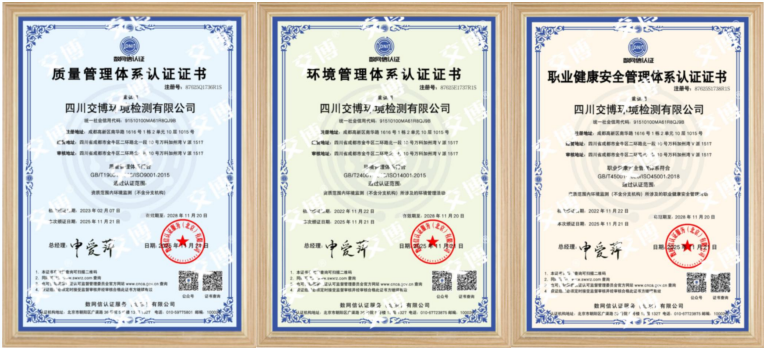
质量管理、职业健康、环境管理认证证书