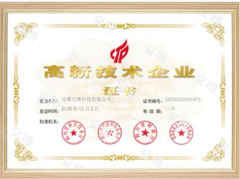
高新技术企业证书