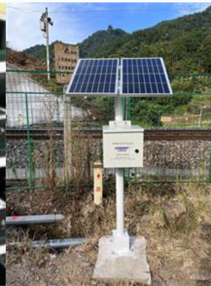
爆破振动自动化监测装备