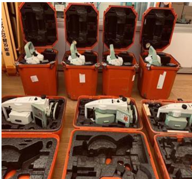
变形自动化监测装备

交博检测拥有 800余套最新款 的爆破测振仪、全站仪、静力水准装置、电水平尺、卫星定位等 自动化监测装备 ，是目前业内拥有仪器数量较多、种类较为齐全、设备较先进的第三方检验检测机构