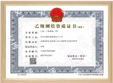
乙级测绘资质证书