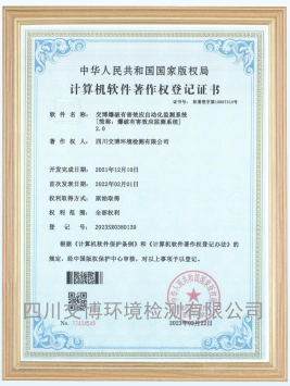
计算机软件著作权登记证书